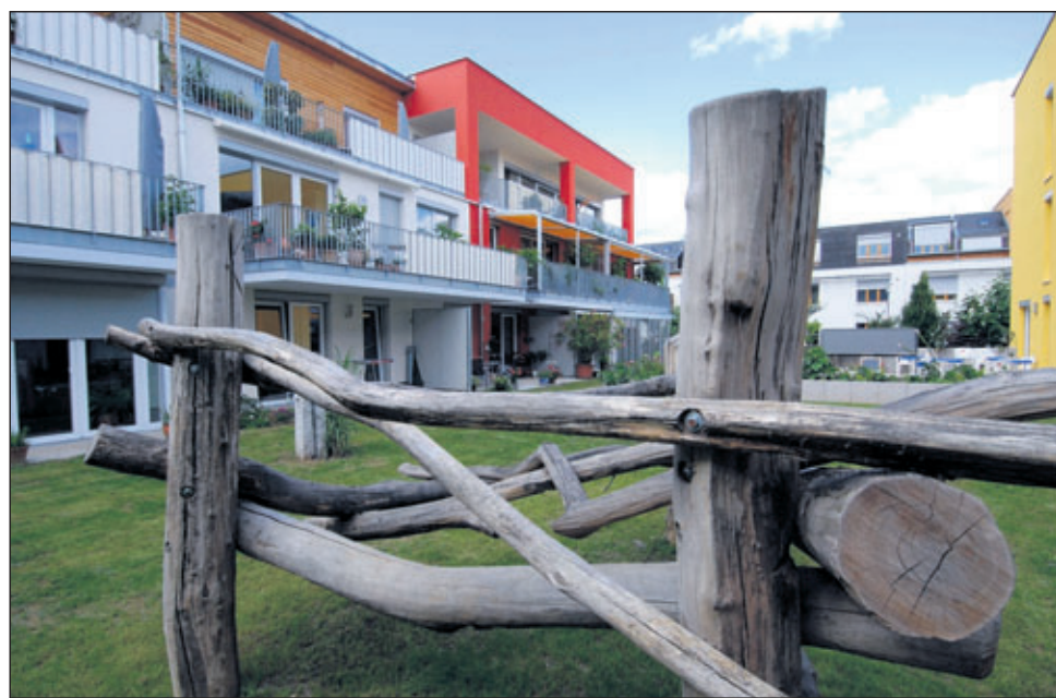
Links: Das Klettergerüst hat eine Besuchergruppe aus Afrika angefertigt. Rechts: Die Kleinen fühlen sich pudelwohl in ihrem geschützten Innenhof.

kleiner Frühstückstisch dort Platz hat. Die Terrassen sind mit warmen Holzplanken ausgelegt und die Wohnungen sind großzügig gestaltet. Weniger ist mehr – lautet das Credo bezüglich der Wände: Wohnküchen schließen sich direkt ans Wohnzimmer an, der Ausgang zum Balkon ist durch mehrere Zimmer möglich.