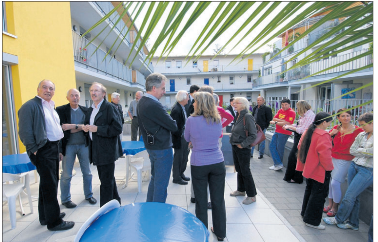
Die Agendamitglieder sind stolz auf ihr Projekt „Mehrgenerationenhaus“. Es gilt als Vorzeigebau im Rems-Murr-Kreis.

Jetzt, sechs Jahre später, haben die Mitglieder der Projektgruppe und die Bewohner ihr Ziel erreicht. Im Komplex wohnen Mieter mit einem kleineren Geldbeutel, Wohnungsbesitzer und Menschen mit Betreuungsbedarf von der Diakonie Stetten. Die Altersstruktur ist bunt gemischt. Betagte wohnen Tür an Tür mit jungen Familien und Singles. Feste werden bei jedem erdenklichen Anlass gefeiert und in sechs verschiedenen Arbeitsgruppen kann jeder seine Fähigkeiten einbringen: Es gibt ein Team für die Cafeteria, für die Technik, die Grünanlagen und den Kinderspielplatz, die Interne Kommunikation und die Öffentlichkeitsarbeit, die Hausverwaltung sowie für die Müll- und Räumdienste. Monatlich finden Hausversammlungen statt, bei Bedarf