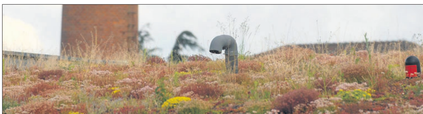
Auf den Dächern des Mehrgenerationenhauses wuchern Kräuter auf einer dünnen Substratschicht. Sie sollen die Isolationsfähigkeit des Daches erheblich verbessern.